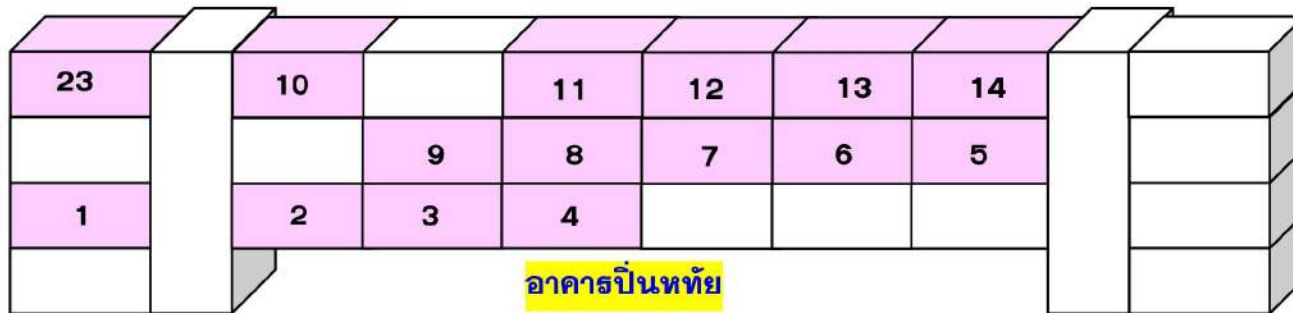
อาคารปิ่นทัย